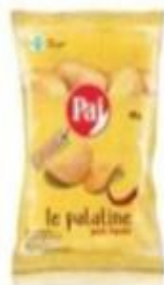
ref. C839 Paprika 45gx 24