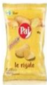
ref. C834 Rigate 45gx 24