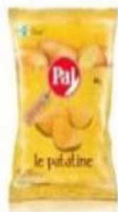
ref. C838 Classiche 45gx 24