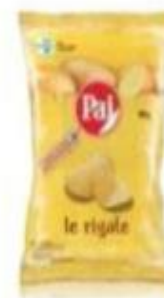
ref. C848 Rigate 100gx 15