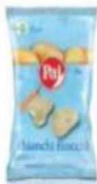
ref. C850 Bianchi Fiocchi 50gX 15