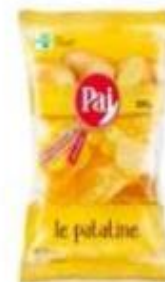
ref. C842 Classiche 300g X 8