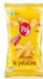
ref. C843 Classiche 240g X 10