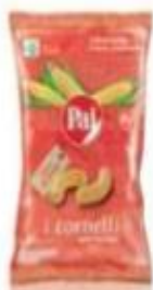
ref. C846 Cornetti al formaggio 35gX 24