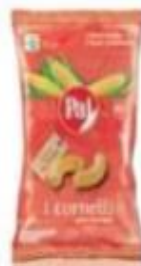
ref. C849 Cornetti al formaggio 60gX 15