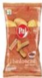
ref. C847 Bastoncini Ketchup 40gX 24