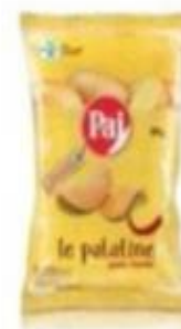
ref. C841 Paprika 100gx 15