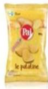
ref. C840 Classiche 100gx 15