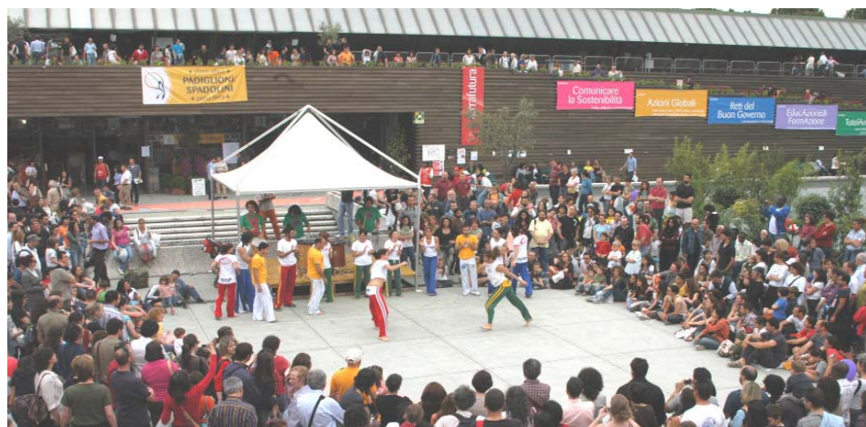
A Firenze dal 29 al 31 maggio la mostra-convegno internazionale delle buone pratiche per un futuro equo e sostenibile (pagg. 2, 3; alla 17 le iniziative dell'Arci)