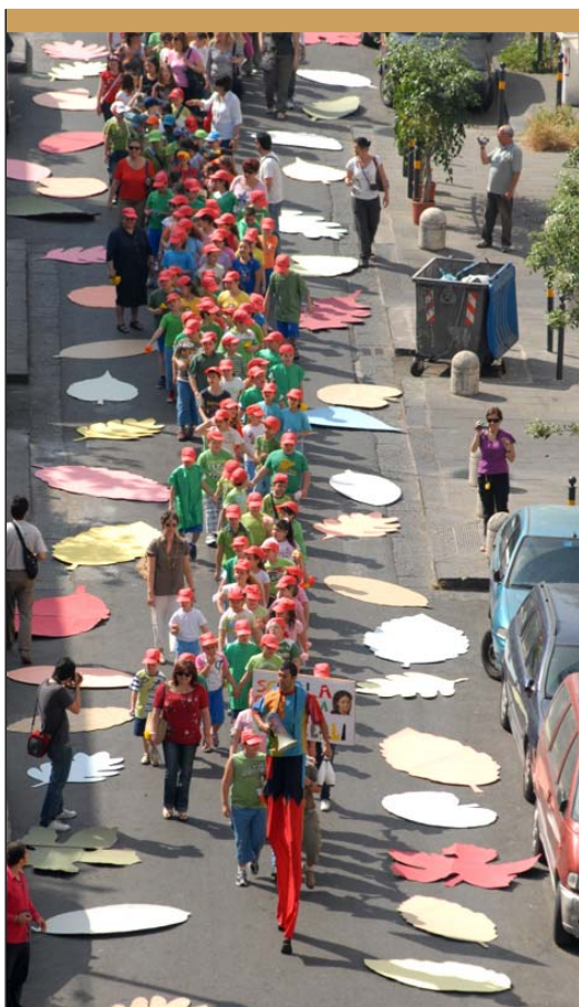
Ponticelli - 22 maggio / La marcia Verde