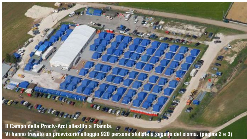
Il Campo della ProciV-Arci allestito a Pianola. Vi hanno trovato un provvisorio alloggio 920 persone sfollate a seguito del sisma. (pagina 2 e 3)