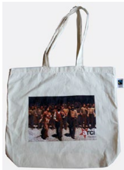
Shopper Quarto Stato ecru certificata Fairtrade (due manici)