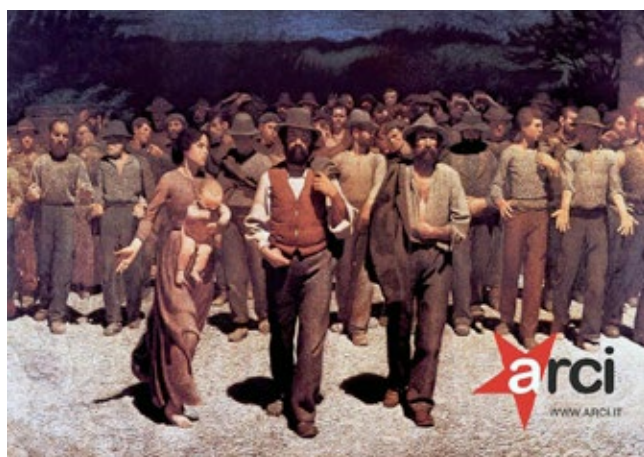
Bandiera Quarto Stato