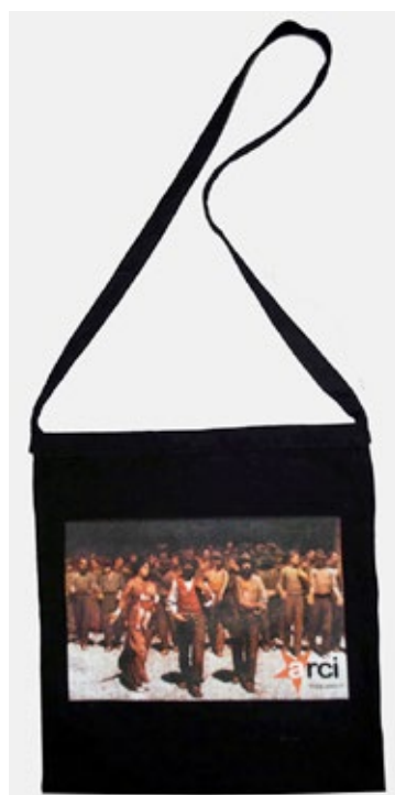
Shopper Quarto Stato nera (manico unico)