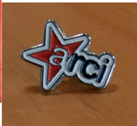
Spilla logo Arci