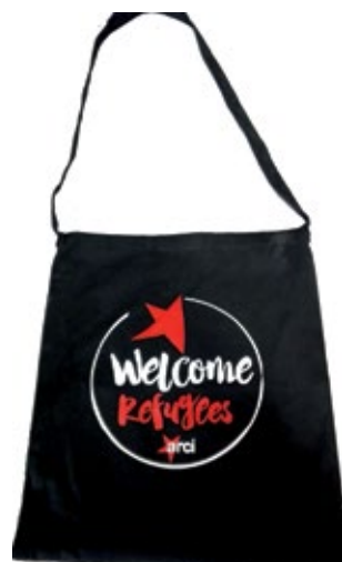
Shopper Welcome Refugees