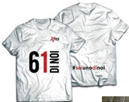
T-Shirt Anniversario 61 anni di Arci