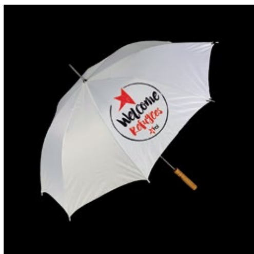
Ombrello Welcome Refugees