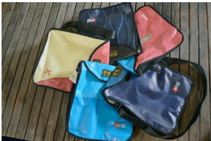
Shopper Materiali riciclati vari colori e disegni

PER QUALSIASI INFORMAZIONE CIRCA LA DISPONIBILITÀ DEI PRODOTTI mail: merchandising@arci.it tel 06 41609508 | 274 fax 06 41609275