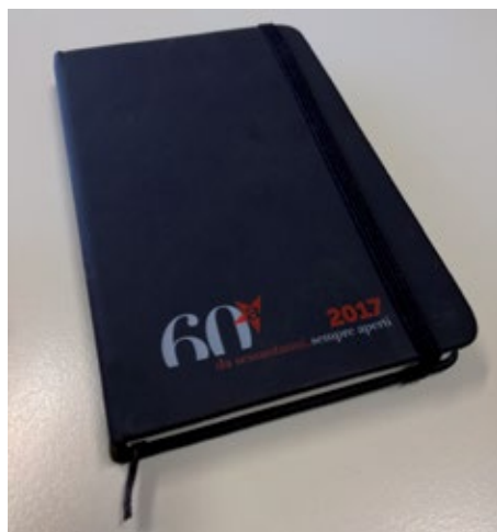
Agendina 60anni Arci

in occasione di ricorrenze come, a mero titolo di esempio, il XXV Aprile, la Giornata della memoria che non sono indicati nella presente informativa di cui vi daremo puntuale informazione nell'apposito spazio dedicato del nuovo Portale Arci e sul sito istituzionale. Ti invitiamo a farci avere proposte, suggerimenti e indicazioni su oggetti a marchio Arci che vorresti per il tuo circolo.