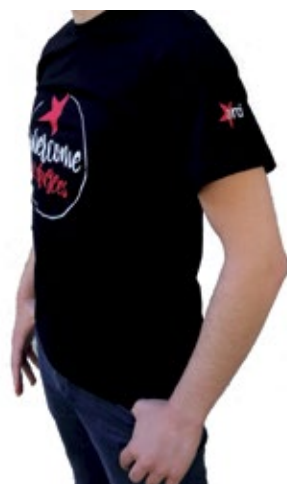
T-Shirt Welcome Refugees (uomo donna)