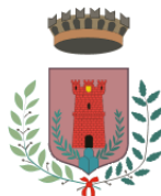
Comune di Poggio Mirteto